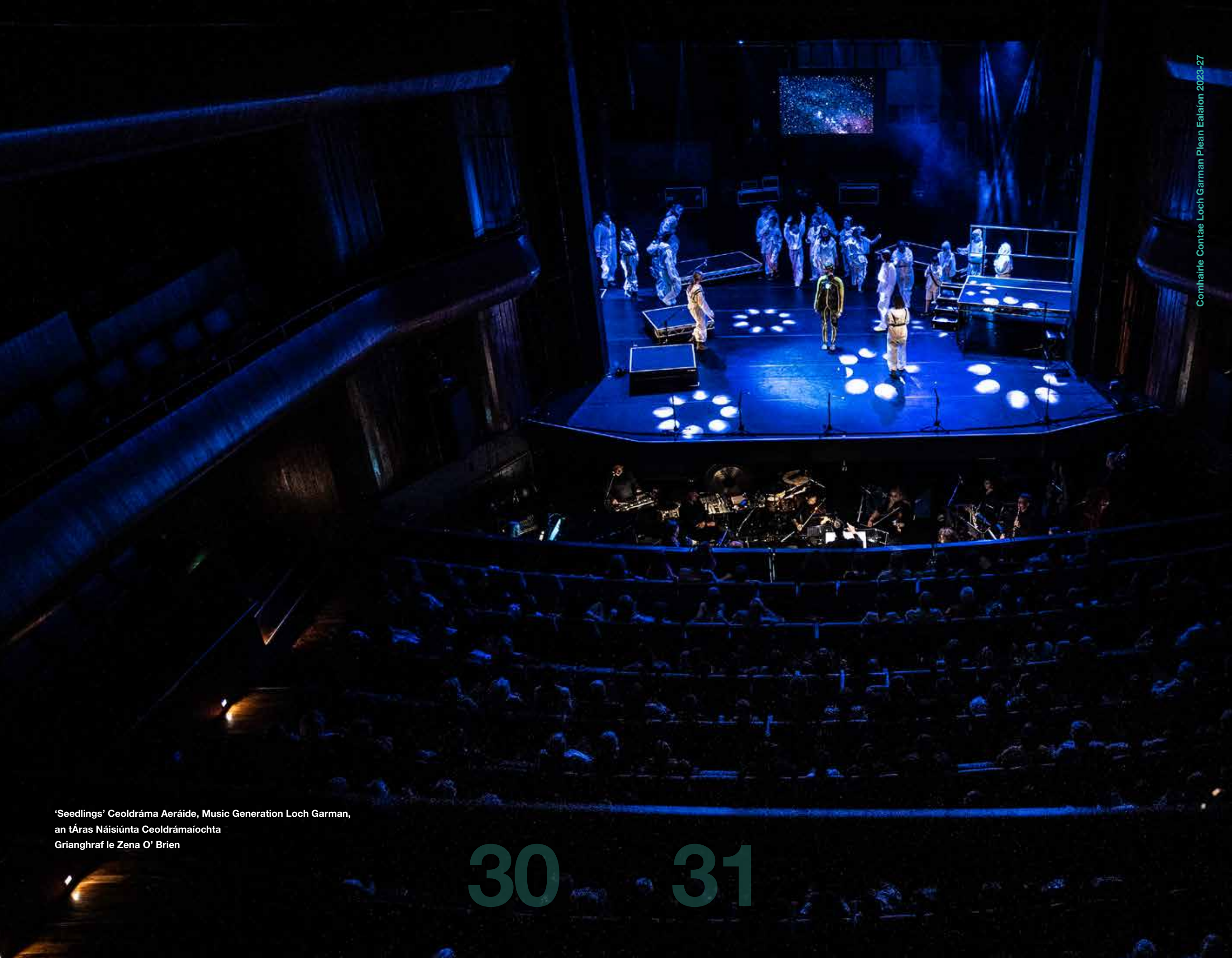
'Seedlings' Ceoldráma Aeráide, Music Generation Loch Garman, an tÁras Náisiúnta Ceoldrámaíochta