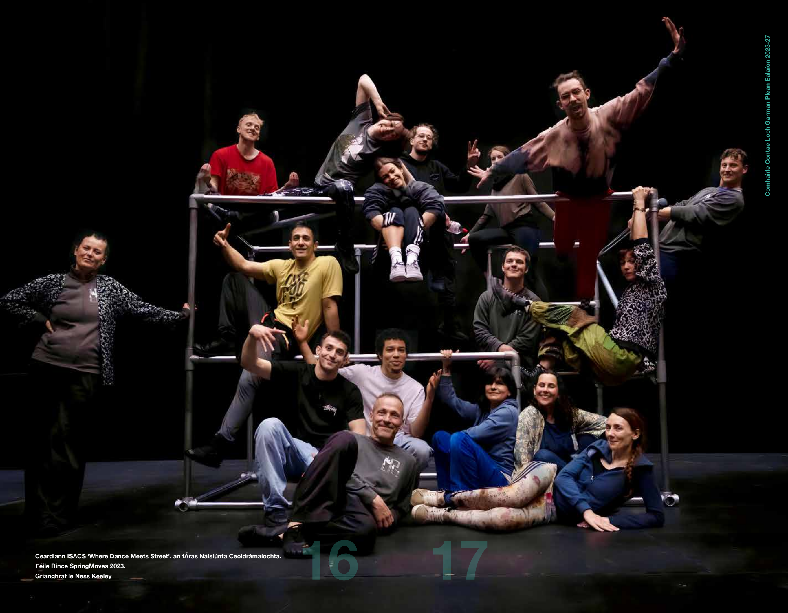
Ceardlann ISACS 'Where Dance Meets Street'. an tÁras Náisiúnta Ceoldrámaíochta. Féile Rince SpringMoves 2023.