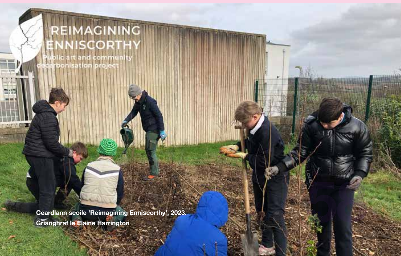
Ceardlann scoile 'Reimagining Enniscorthy', 2023.