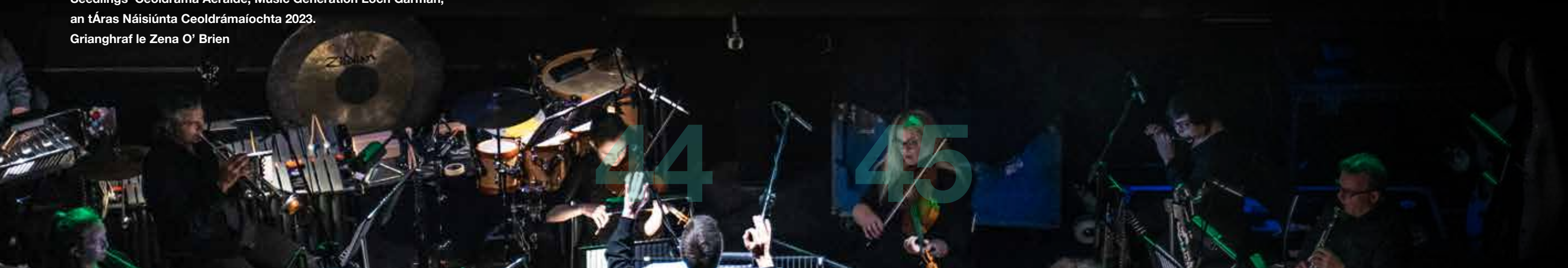
Seedlings' Ceoldráma Aeráide, Music Generation Loch Garman, an tÁras Náisiúnta Ceoldrámaíochta 2023.

Chomh maith leis na sé sprioc seo, beidh fócas polasaí ar Éagsúlacht, Ionchuimsiú Sóisialta & Comhionannas mar bhonn agus mar thaca ag ár gcuid oibre go léir, ag tabhairt bonn eolais do na gníomhartha a dhéanaimid chun ár gcuspóir a bhaint amach. Ina theannta sin, mar bhonn agus mar thaca ag ár gcuid oibre tá beartas idirnáisiúnta maidir le forbairt inbhuanaithe mar atá leagtha amach ar Spricanna na NA ar Fhorbairt Inbhuanaithe, agus beartas náisiúnta faoin bPlean Gníomhaíochta ar son na hAeráide.