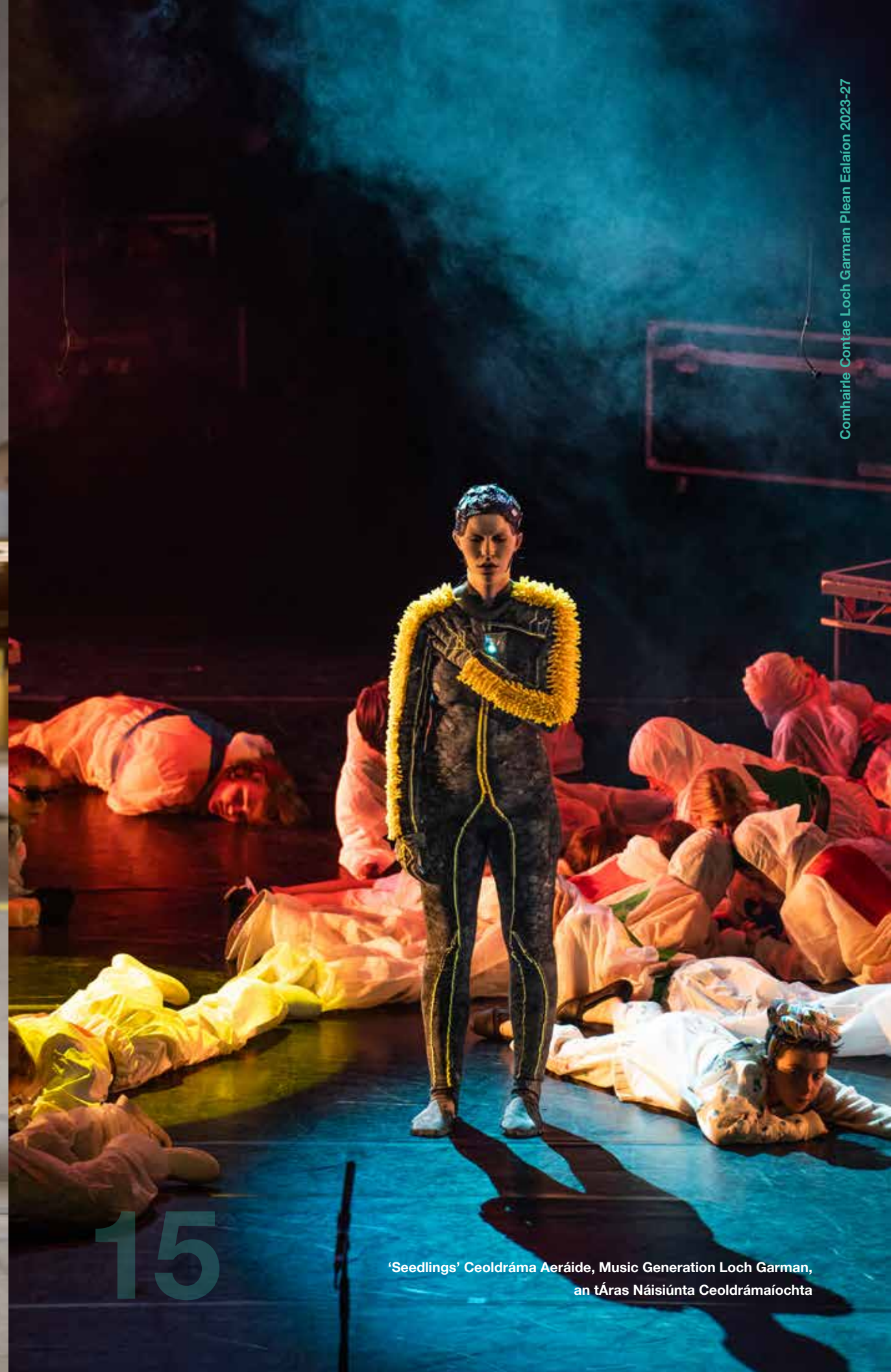
'Seedlings' Ceoldráma Aeráide, Music Generation Loch Garman, an tÁras Náisiúnta Ceoldrámaíochta